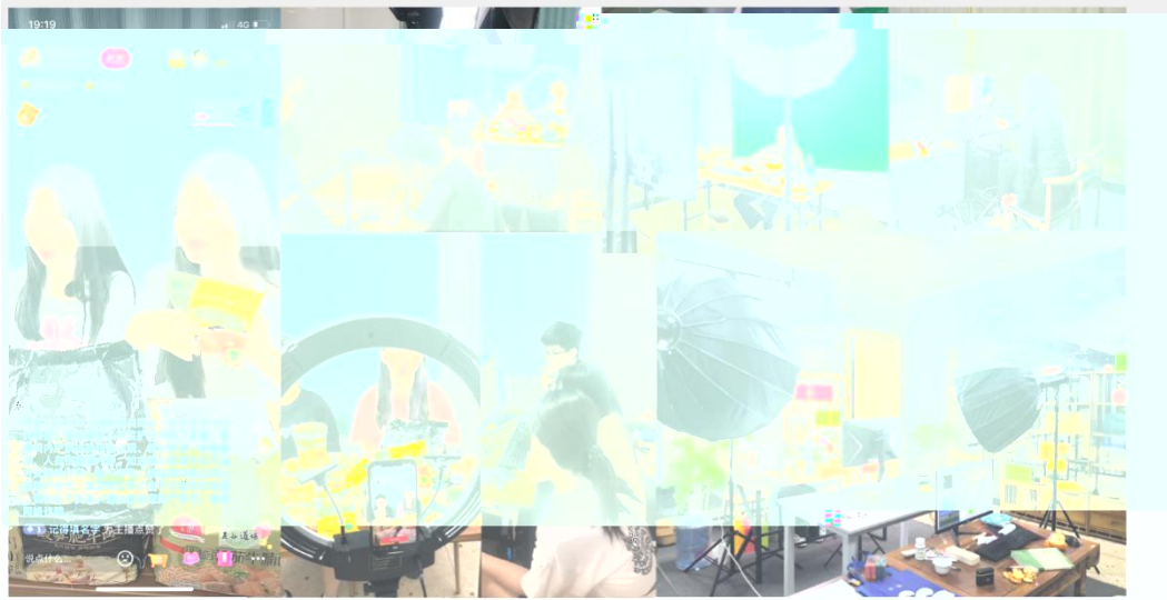
部份学员在直播间进行电商直播实训现场